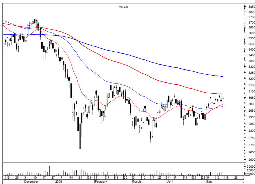
Rys. nr 1 WIG20 - wykres dzienny świecowy