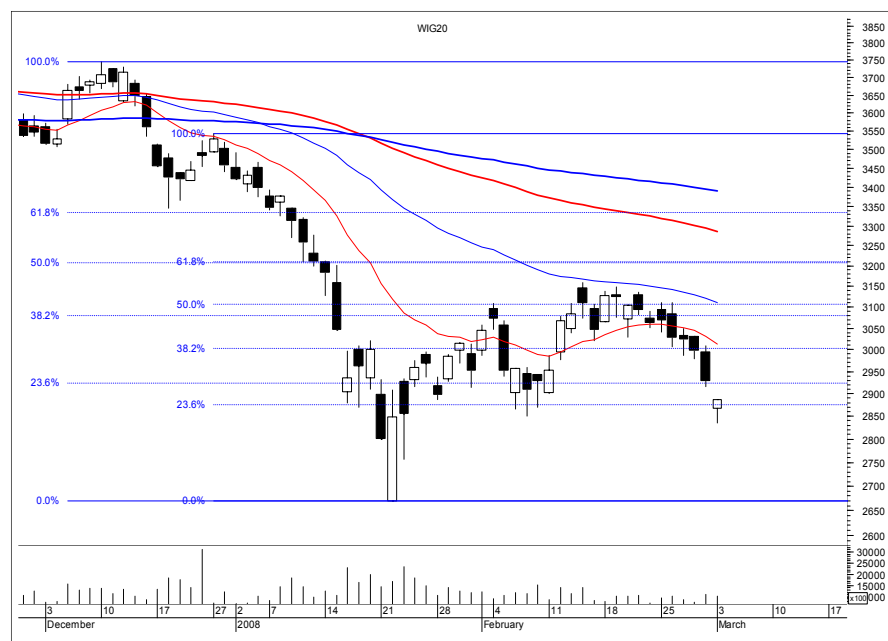
Rys. nr 1 WIG20 - wykres dzienny świecowy