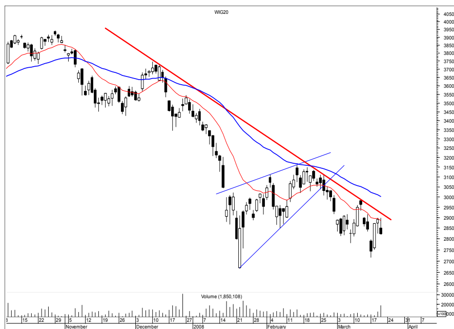
Rys. nr 1 WIG20 - wykres dzienny świecowy