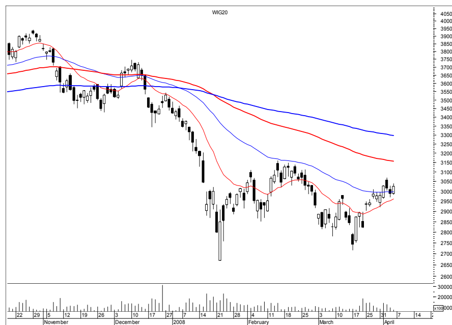
Rys. nr 1 WIG20 - wykres dzienny świecowy