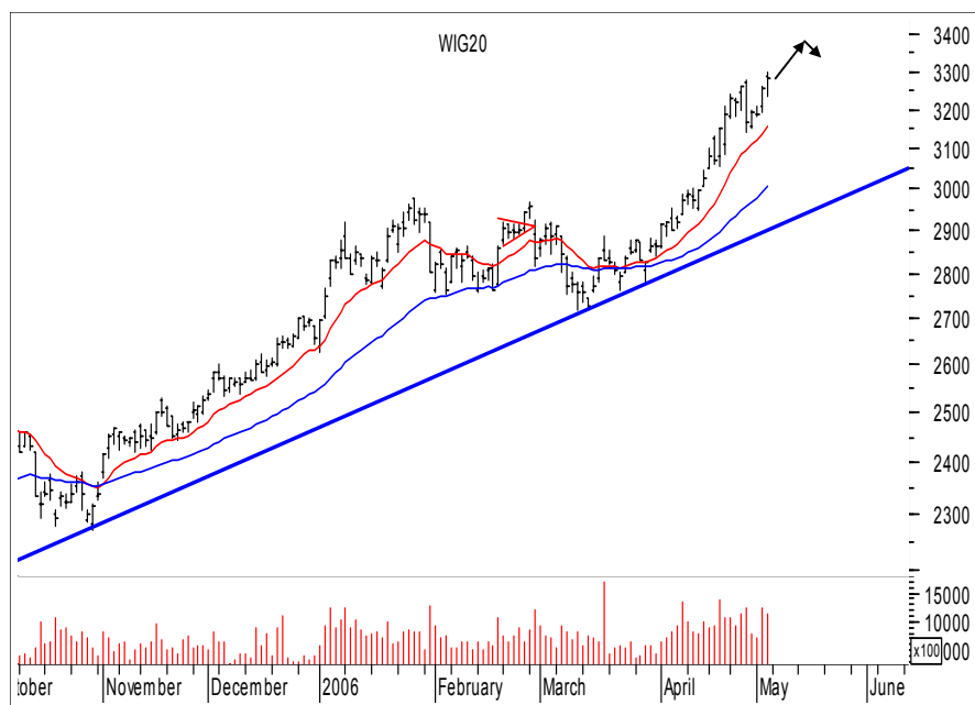
Rys. nr 1 WIG20 - wykres dzienny słupkowy