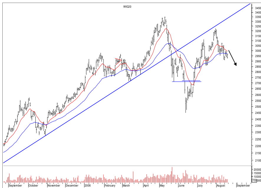
Rys. nr 1 WIG20 - wykres dzienny słupkowy